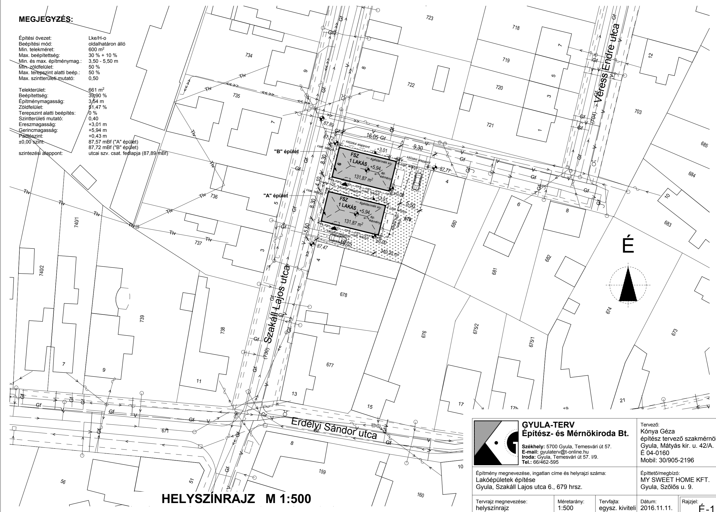
HELYSZÍNRAJZ M 1:500

Telekterület: 661 m 2 Beépítettség: 39,90 % Építménymagasság: 3,54 m Zöldfelület: 51,47 % Terepszint alatti beépítés: 0 % Szintterületi mutató: 0,40 Ereszmagasság: +3,01 m Gerincmagasság: +5,94 m Padlószint: +0,43 m ±0,00 szint: 87,57 mBf ("A" épület) 87,72 mBf ("B" épület) szintezési alappont: utcai szv. csat. fedlapja (87,89 mBf)